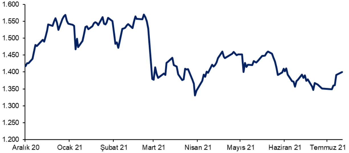
Şekil 2: BIST100 Endeksi