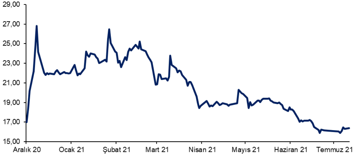
Şekil 1: Arzum'un Halka Arz Tarihinden Bugüne Pay Fiyatı

Arzum payları, Borsa İstanbul'da 24 Aralık 2020 tarihinde 17,00 TL fiyattan işlem görmeye başlamıştır. Şirket paylarının 2 Ağustos 2021 tarihindeki borsa kapanış fiyatı 16,40 TL'dir.